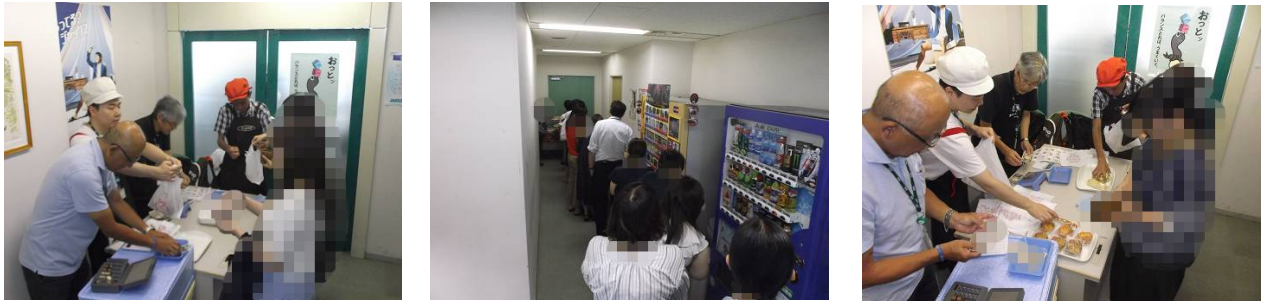
がつ 29 日(水)、四谷にあります、ポプラ社様にてパン製品の販売をさせて頂きました。