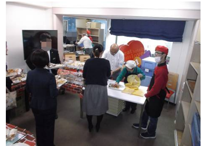
がつ か きん さま ほんしやさま はんばい いただ 2月2日(金)、近畿日本ツーリスト様、本社様にて販売をさせて頂きました。