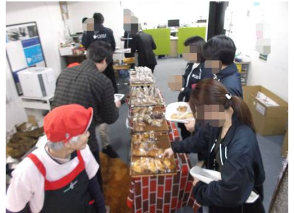
がつ か もく かぶしかいしやだいきよさま ほんしやさま はんばい いただ 2月8日(木)、株式会社大京様、本社様にてパン販売をさせて頂きました。