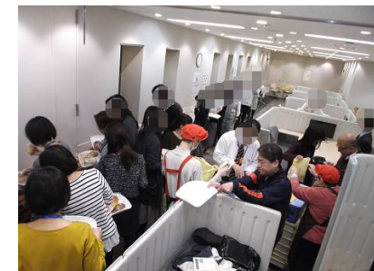
がつ にち もく かぶしかいしやだいきよさま てんさま はんばい いただ 2月15日(木)株式会社大京様、ORIXビル店様にてパン販売をさせて頂きました。