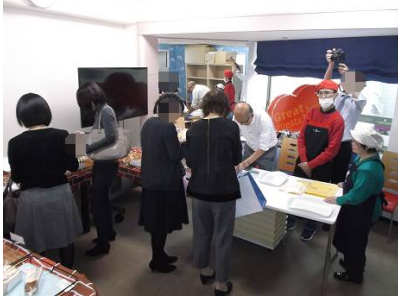
がつ たち もく とうきようさま はんばい いただ 2月1日(木)、ANAインターコンチネンタルホテル東京様にて販売をさせて頂きました。